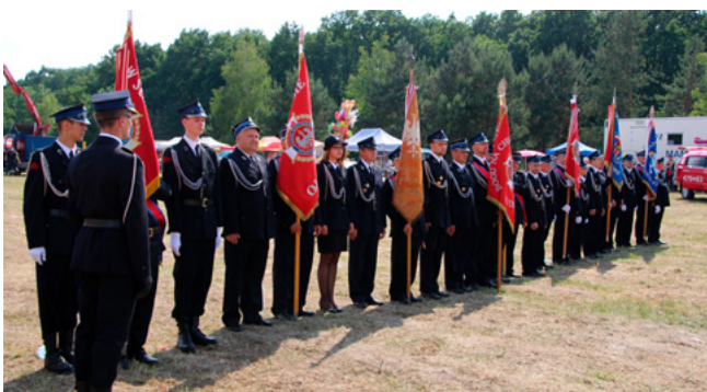
Fot. Począty sztandarowe na uroczystościach