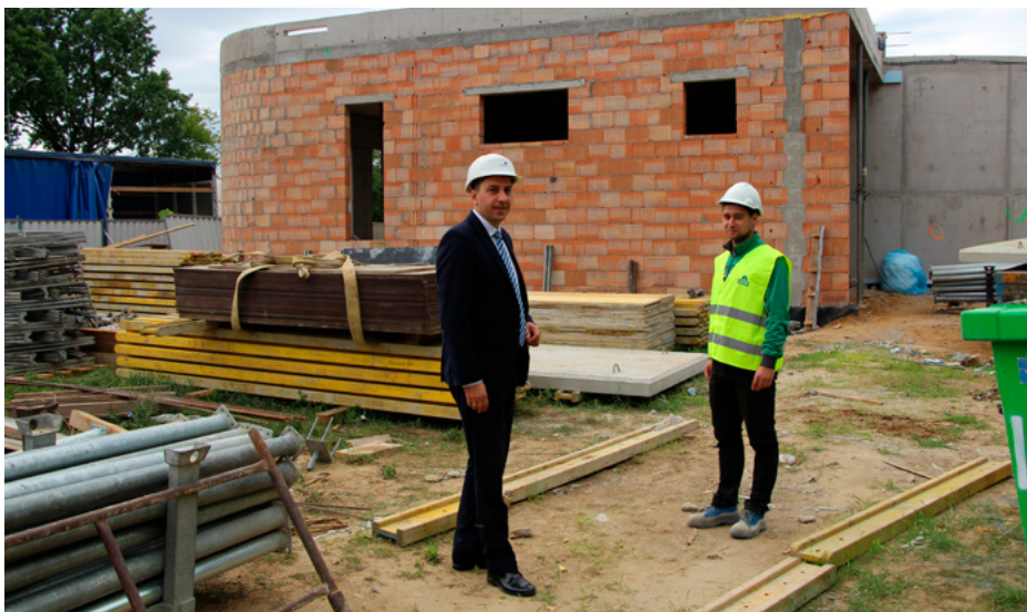
Fot. Stacja uzdatniania wody w Chotomowie

Prace przy Zadaniach związanych z budową sieci wodociągowych i kanalizacji sanitarnej są również zaawansowane. Na ulicy Willowej i Promiennej w ramach realizacji Zadania 3, trwa budowa kanalizacji. Na tym odcinku wystąpiła konieczność odwadniania wykopów, co wydłuża realizację prac. Działania przy budowie sieci kanalizacyjnej prowadzone są także na ulicy Bagiennej, w ramach Zadania 2. Podobne roboty Wykonawca prowadzi w okolicy przepompowni P11, na ulicy Jarzębinowej i Dolinowej w zakresie Zadania 10. W tej chwili budowane są tam najgłębsze odcinki. Natomiast na ulicy bez nazwy, w rejonie od Łąkowej do Kisielewskiego (Zadanie 11) trwają prace przygotowawcze do budowy wodociągu. Na ulicy Kisielewskiego budowa