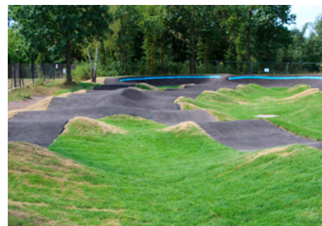
Fot. Teren budowy pumtracka w Skierdach

W trakcie uroczystego otwarcia pumtracka przeprowadzone zostaną mini-zawody dla najmłodszych oraz rozgrzewka, wspólny trening czyli nauka „pompowania”, uczestnicy zapoznają się z jazdą na pumtracku, dowiedzą się jak przygotować pozycję i poznają podstawowe zasady poruszanie się po torze.