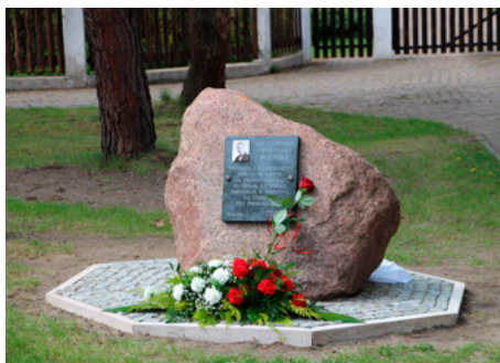
Fot. Obelisk z tablicą pamiątkową

Pod koniec kwietnia w Dąbrowie Chotomowskiej odsłonięty został obelisk upamiętniający słynnego polskiego inżyniera.