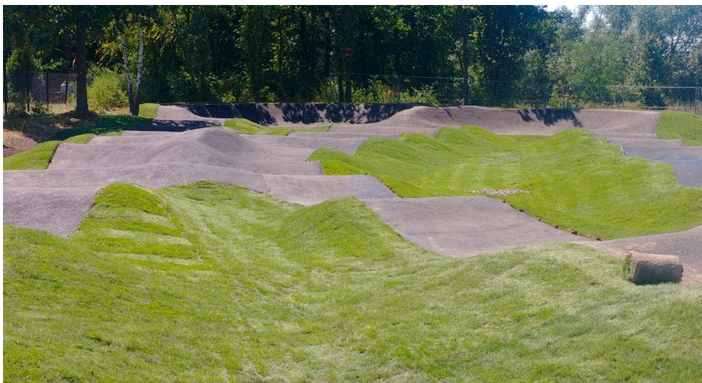
Fot. Pumpruck w Skierdach