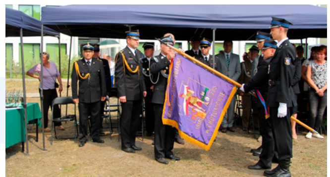
Fot. Obchody 100 lecia OSP Chotomów